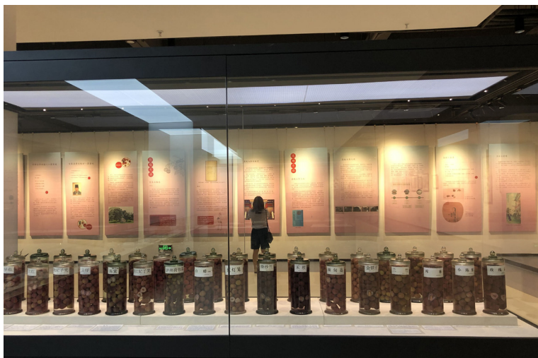
“荔质文心”荔枝文化展一角

艺的高超水准。策展人精心挑选了肇庆端砚、广州广绣、佛山陶艺等一批现代非遗大师作品进行展示，让观众进一步了解荔枝艺术从古至今的传承与发展。