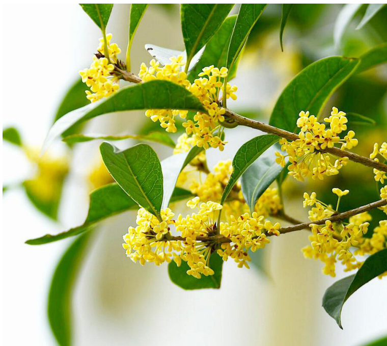
桂花香飘四溢 | 摄影 | 深白