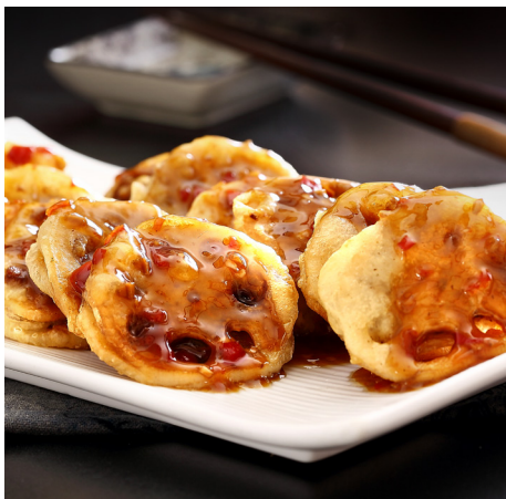
酿藕夹（上）、凉拌藕片（下）