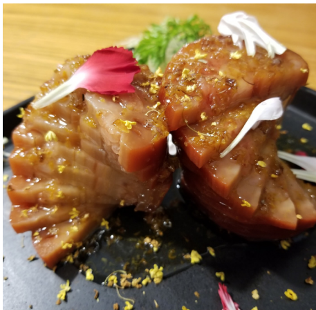
桂花糖藕

凉拌藕片 要想藕片脆爽，一定要选对九孔莲藕做凉拌菜。将莲藕洗净切成片，过热水焯约2、3分钟后立即加入凉水，捞出沥干，放凉，撒入白糖、醋、盐、葱姜拌匀即可。因为莲藕中含多酚类化学物质，跟铁离子结合会形成蓝紫色有色络合物，因此做菜忌用铁锅和铁制器皿，以免引起莲藕发黑影响美观。■