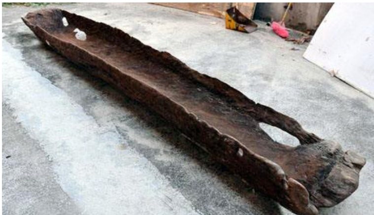
广东高州出土的独木舟

利于渔业捕捞生产。据史料推断，改进版的木板组合的渔船在商朝就出现了。由于使用了木板建造渔船，渔船的尺度与性能也就能反映出来，《管子·禁藏篇》中说，“渔人之入海，海深万仞，就彼逆流，乘危百里，宿夜不出者，利在海也。”能在汹涌的波涛中逆流，并且可以晚上不返航，说明这时的渔船已经不是独木舟了。