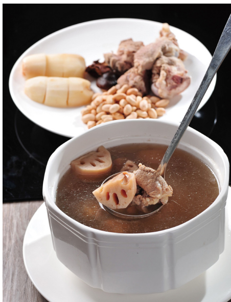
沙田莲藕汤

花蜜、撒上桂花花瓣，蒸熟的莲藕有了糯米的醇香，糯米有了莲藕的清爽，成品粉红透明，口感软糯清润。这道菜自江浙地区传来，