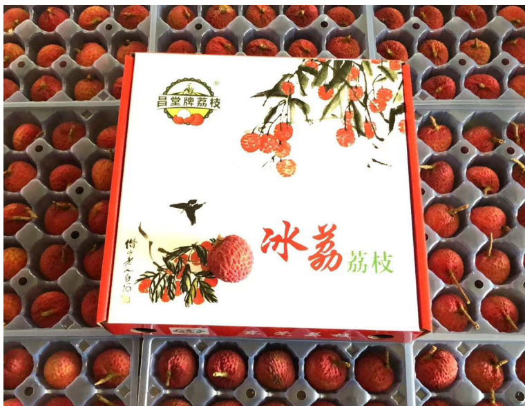
精装的冰荔荔枝