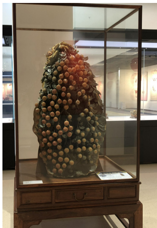
砥“荔”前行

省端砚协会组织征集的荔枝题材端砚精品有十余件，这些作品雕刻技艺精致古朴、细腻含蓄，其中《砥“荔”前行》是本场展厅里最大亮点之一，作品高达1.2米，玲珑浮凸，繁简得当，能给观众带来强烈的视觉冲击，展现了当代端砚雕刻工