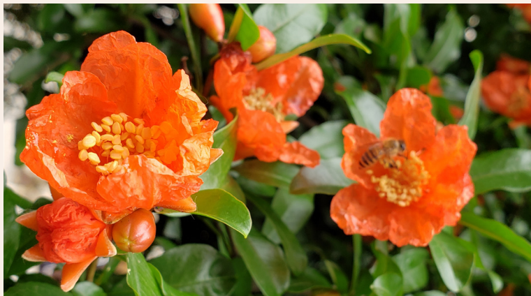
2019年夏天，江南的石榴花

就成为端午当令植物，宋代杨万里《端午独酌》便是与此花对饮的：“招得榴花共一觞。”