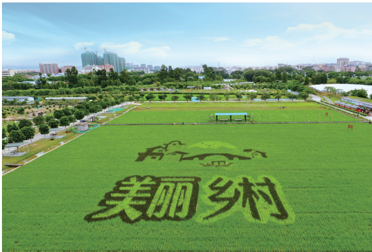
美丽乡村创意稻田

最流行的花语体系梳理了荔枝的历史文化和地域故事；《红土荔香书岭南——东莞大岭山荔香文化展》则成为本土荔枝文化传承的见证；《中国荔枝的文化魅力》从农耕文化的高度，提出大力宣传和保护荔枝文化。《节花小札：端午·六月六·七夕》写节日间簪花、闲花、荷莲，只取“枝节”，分享时光，在纷繁忙碌中让人体会到“卧看牵牛织女星，月转过梧桐树影”的清涼。此外，秋季卷还收罗了地方志中东莞的乡村文化与社会、渔船的变迁、渔网编织技艺等颇具岭南特色的农耕文化篇章，对于农耕文明符号的搜集整理，不断呼应着耕读人的初心。