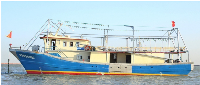
大型玻璃钢灯光围网渔船

针对我市渔船“老、小、旧”的突出问题，2015年东莞市政府设立1亿元渔船更新改造贴息贷款专项资金，引导全市渔船“以木改钢、以小改大”，逐步实现“大型渔船钢质化、中小型渔船玻璃钢化”，实现了渔船转型升级。目前，东莞市现有渔船260艘，其中，海洋捕捞渔船210艘，内陆江河捕捞渔船50艘。其中新建渔船146艘，钢质渔船约61艘，总长最长的有45米，主机功率500多千瓦，可以航行到珠江口的外海海域生产作业，有的渔船甚至航行到南海的渔场生产作业。